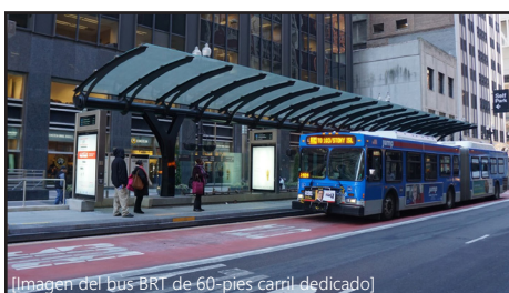
[Imagen del bus BRT de 60-pies carril dedicado]