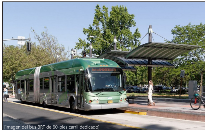
[Imagen del bus BRT de 60-pies carril dedicado]

BRT utiliza carriles dedicados y estaciones modernas para proporcionar un servicio rápido y rentable a puestos de trabajo, entretenimiento y escuelas. El BRT de Madison complementará las rutas existentes de Metro y será el próximo gran paso de nuestra ciudad hacia un sistema de tránsito local mas sostenible.